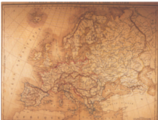
Europako mapa 1820. urte inguruan ©Jean Vigne