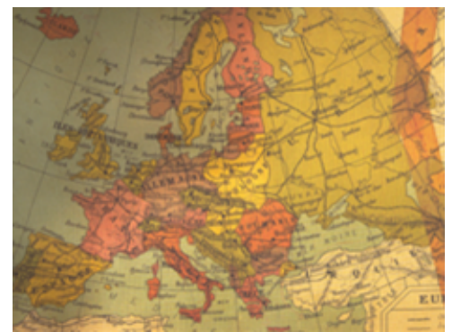
Europako mapa 1920 eta 1937 bitartean. ©Jean Vigne